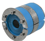
Uszczelnienie RS BG™